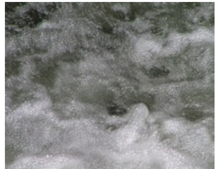
809-Video-Paintings - Photography, 2008