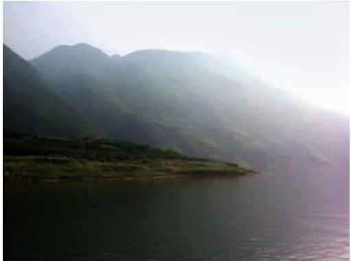
No Title - Video, 2008