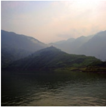
No Title - Photography, 2008