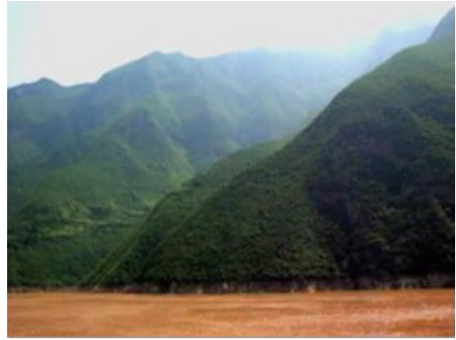
No Title - Video, 2008